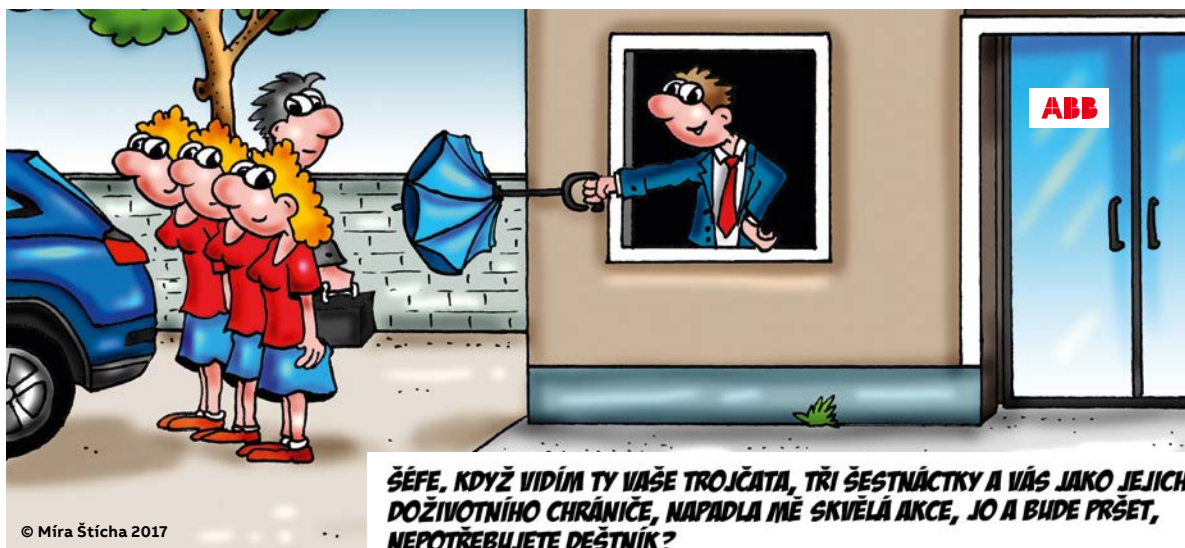
ABB s.r.o., divize Elektrotechnické výrobky Kontaktní centrum Tel.: 800 312 222 E-mail: kontakt@cz.abb.com

Každé video bude odměněno dárkem. 3 nejlepší videa získají prioritní umístění na YouTube ABB a dárek v podobě zkoušečky.