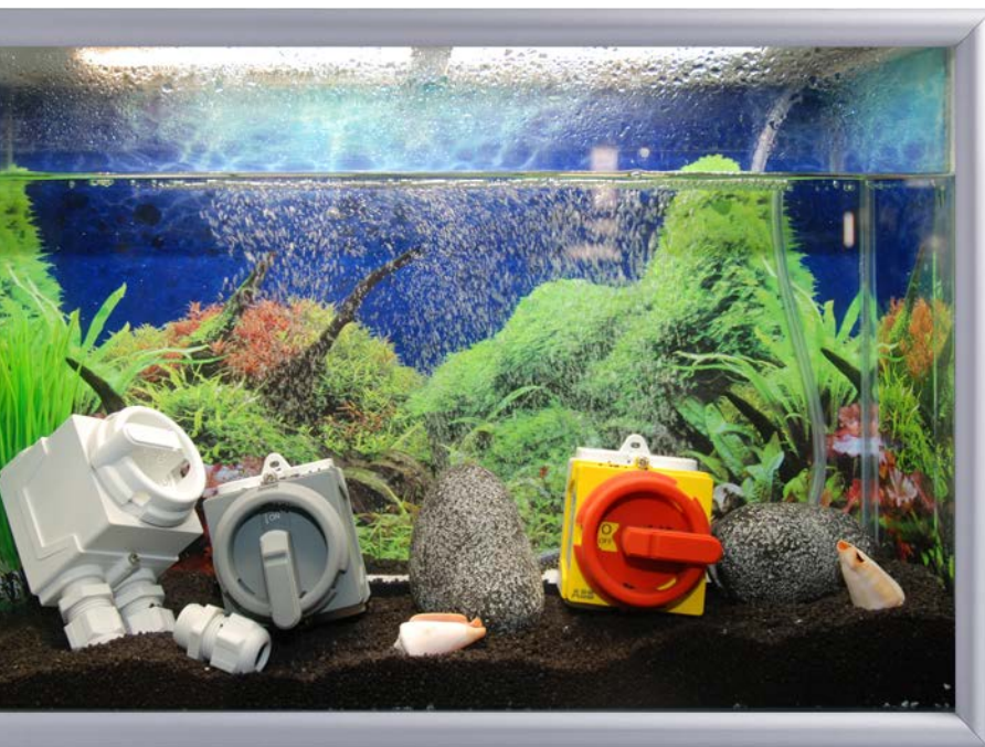
— 01 Odpínače ONE20 v odolných krytech do extrémních podmínek

V dnešním převisu nabídky nad poptávkou obstojí jen ti nejlepší, ale už jednání s potenciálními zákazníky před veletrhem a následné kladné reakce návštěvníků na veletrhu naznačují, že odpínač ONE20 má budoucnost jistou. První reakce byly velmi pozitivní. Na veletrhu sklídl zasloužené uznání jak od odborníků, tak i běžných uživatelů. Líbí se zejména jeho kompaktní rozměry a možnost montáže do venkovního prostředí, a to i do extrémních podmínek. Také ostatní vlastnosti a technické parametry, o kterých jste si mohli přečíst v minulém vydání tohoto bulletinu, byly velmi oceňovány.