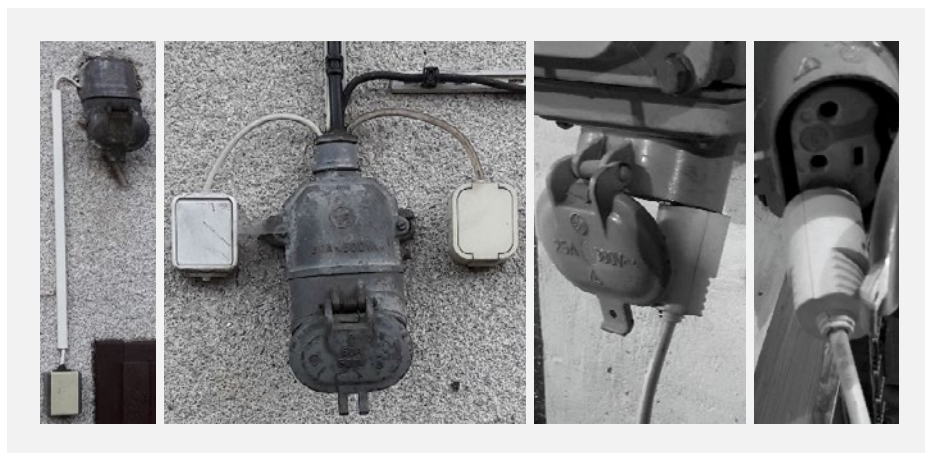
Alternativní způsoby připojení jednofázového přívodu do zásuvky třífázové