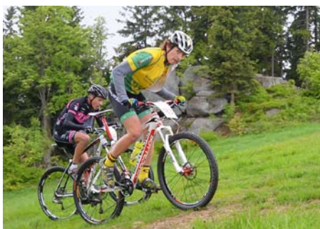
Převýšení více jak 1 500 m zahájilo každého.